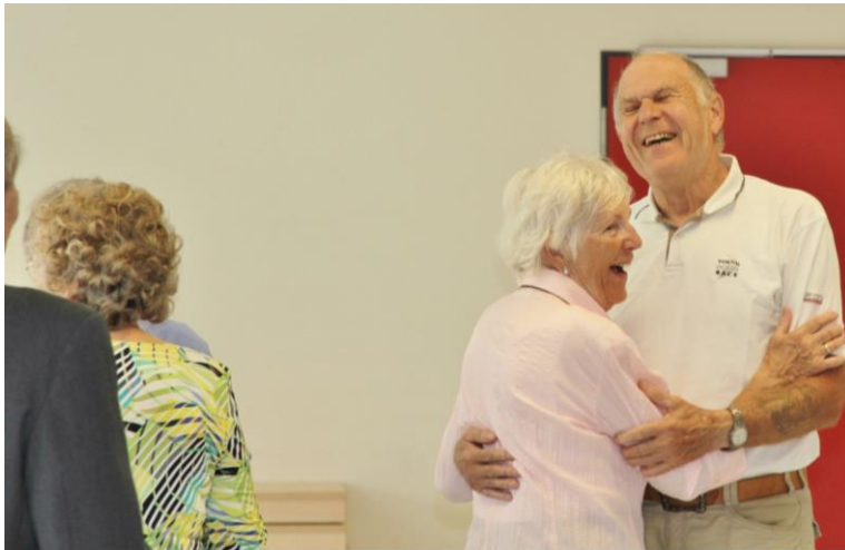
Tanzcafé | Rostock u. a. Förderung von Bewegung und Beweglichkeit, Lebensfreude, Erinnerungen wecken