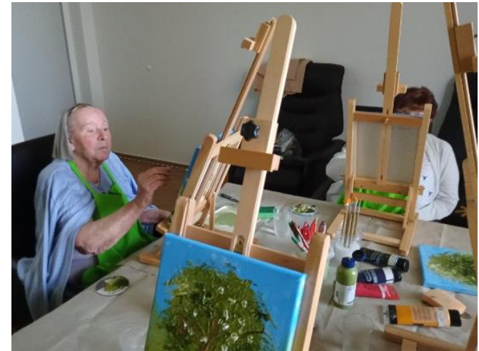
Kreativität trotz(t) Demenz | Rostock + LK NWM Förderung von Kreativität