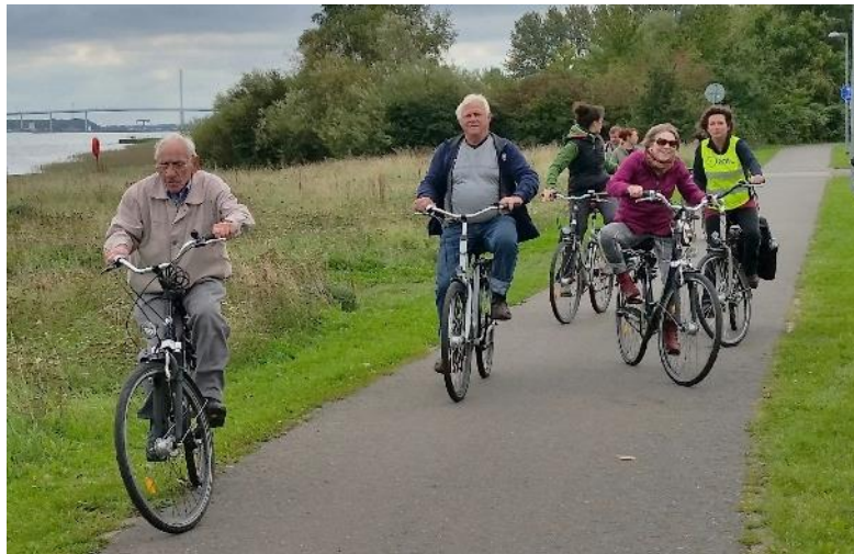
Radtouren I Stralsund und Umland Förderung von Bewegung und Beweglichkeit, Körpergefühl, Miteinander, Freude