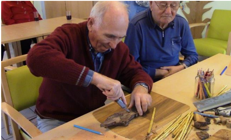
Holzbildhauer | Stralsund Förderung der Oberflächen- und Tiefensensibilität und Stärkung des Selbstwertgefühls, Ausdauer