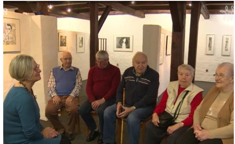
Kunst-Pause vom Vergessen | M-V weit Befähigung von Kultureinrichtungen, um kunstgerago- gische und intergenerative Angebote zu entwickeln