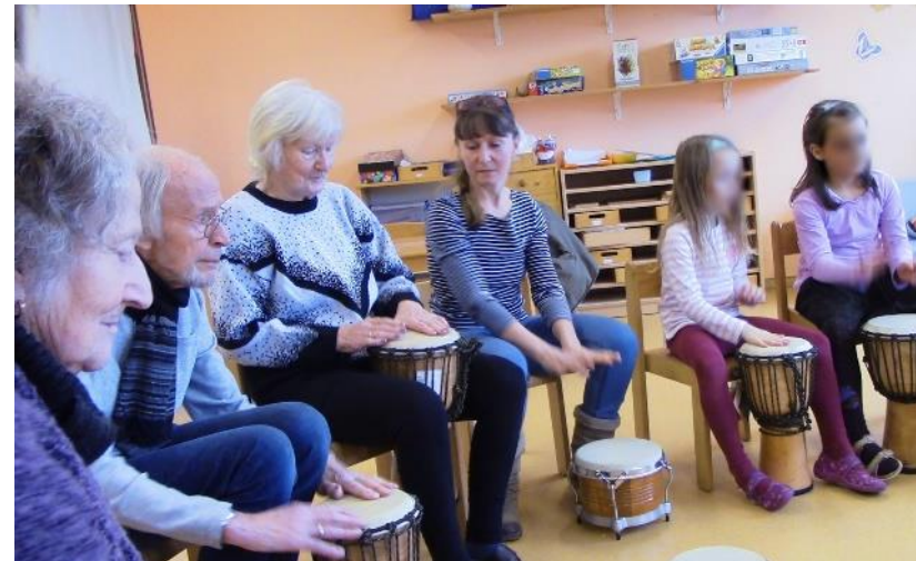
Trommeln generationenübergreifend I Stralsund Förderung von musikalisch-rhythmischer Bewegung, Freude, wertschätzender Umgang miteinander