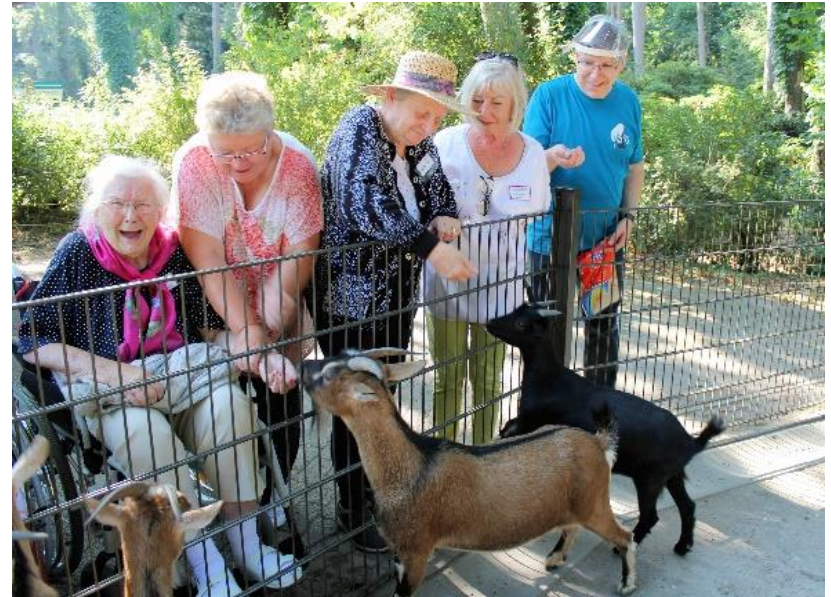
Konzipierte Führungen | Zoo Rostock Förderung von Sinneswahrnehmungen durch direkten Kontakt mit den Tieren