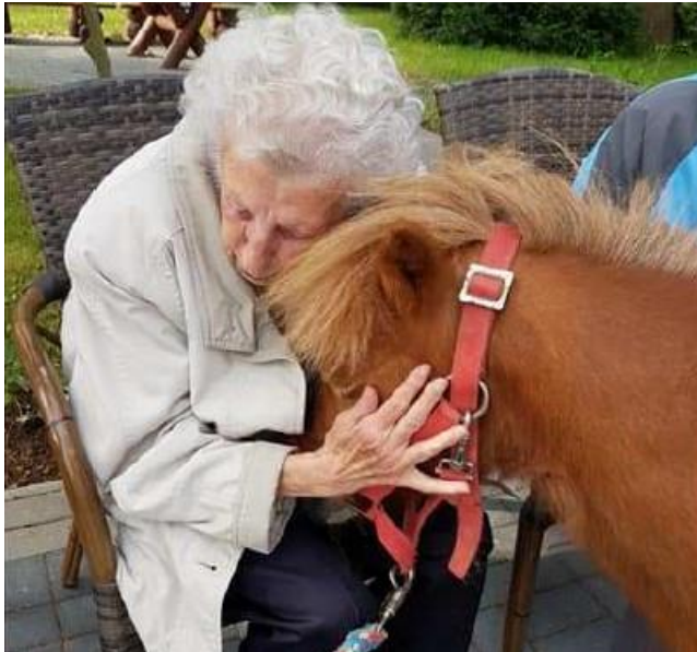
Tiergestützte Therapie | Kröpelin und Umgebung Förderung von Bewegung und Beweglichkeit, Sinneswahrnehmungen